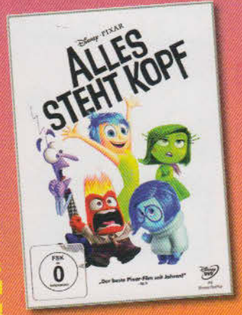
Alles steht kopf • Disney • Pixar • 1 DVD • etwa 13 Euro

Fünf Gefühle übernehmen im Kopf der elfjährigen Riley das Kommando: die strahlende „Freude“, der klapperdürre „Angst“, die unglückliche, pummelige „Kummer“, die aufmerksame „Ekel“, der zornige „Wut“. Als Riley mit ihren Eltern in eine neue Stadt ziehen muss, geben sie alles, um Riley durch diese schwere Zeit zu helfen – und richten dabei ein großes DURCHEINANDER an. Bei den Zuschauern fahren die Gefühle ebenfalls Achterbahn: „Alles steht kopf“ ist traurig und tiefgründig, aber auch zum Brüllen komisch!