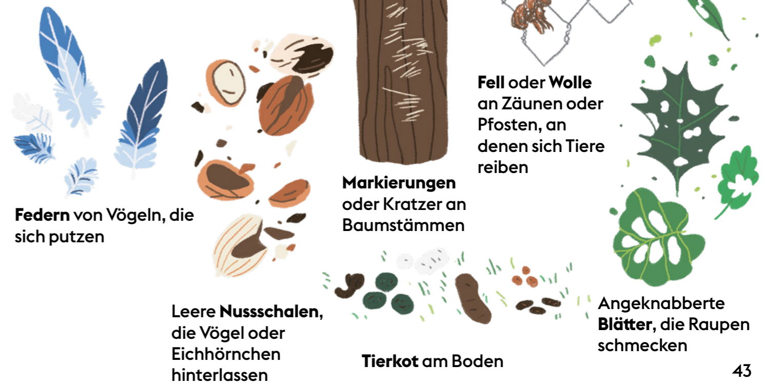
Federn von Vögeln, die sich putzen