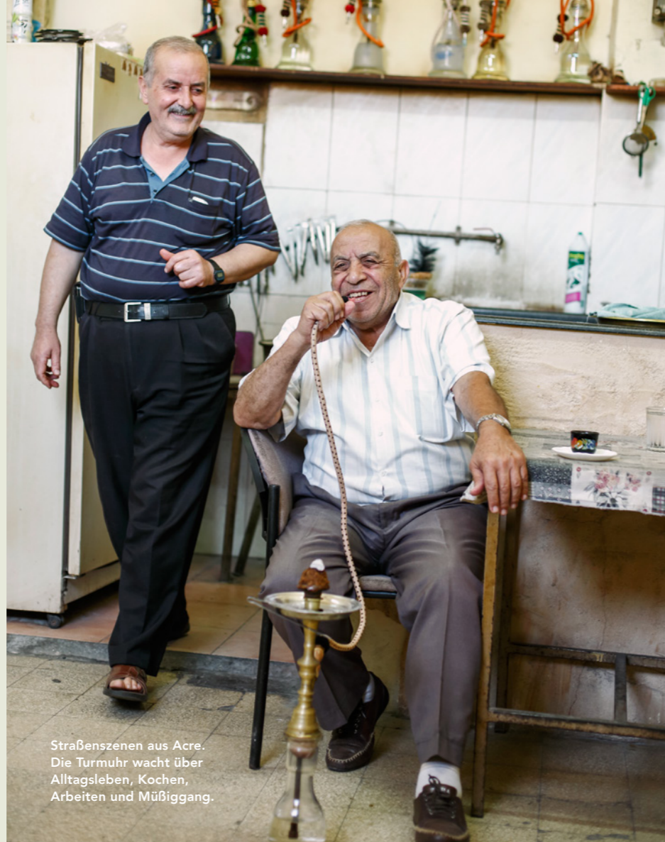
Straßenszenen aus Acre. Die Turmuhr wacht über Alltagsleben, Kochen, Arbeiten und Müßiggang.