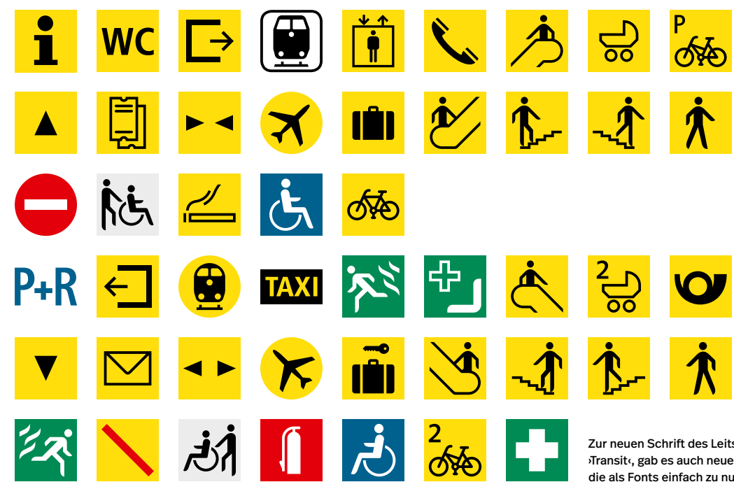
Zur neuen Schrift des Leitsystems, der 'Transit', gab es auch neue Piktogramme, die als Fonts einfach zu nutzen sind.