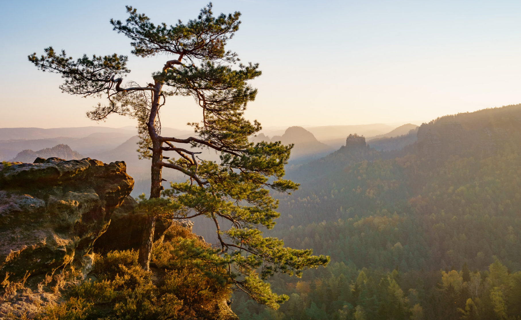
↑ Der Sonnenuntergang macht die Landschaft zum Gemälde ↓ Dramatische Felsformationen im nebligen Sonnenaufgang

Formen in diese felsige Landschaft gemeißelt und so ein unvergessliches Panorama aus atemberaubenden Bergspitzen, beeindruckenden Hochebenen und steil abfallenden Felswänden geschaffen. Während der Kreidezeit vor über 90 Millionen Jahren befand sich hier ein Binnenmeer. Erst als sich das Wasser nach und nach zurückzog, offenbarten sich die einzigartigen Formen, die das Meer in die Gebirgssteine geschliffen hatte. Und die dunkleren Basaltberge, die man immer wieder zwischen den Sandsteinfelsen findet, erinnern an die vulkanischen Aktivitäten, die hier ebenfalls ihre Spuren hinterlassen haben.