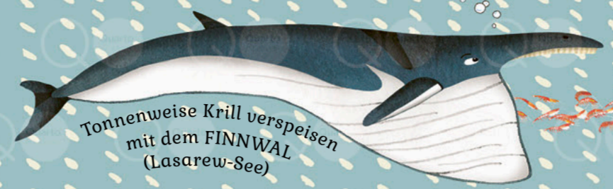
Tonnenweise Krill verspeisen mit dem FINNWAL (Lasarew-See)