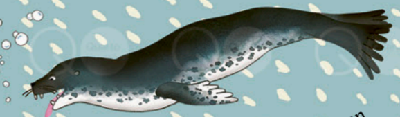
Durchs Meer streunen mit dem SEELEOPARDEN (Königin-Maud-Land)