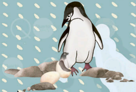
Nachwuchs ausbrüten mit dem ZÜGELPINGUIN (Deception Island)