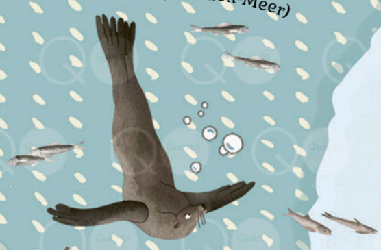
Warm eingepackt mit dem SEEBÄREN (Weddell-Meer)