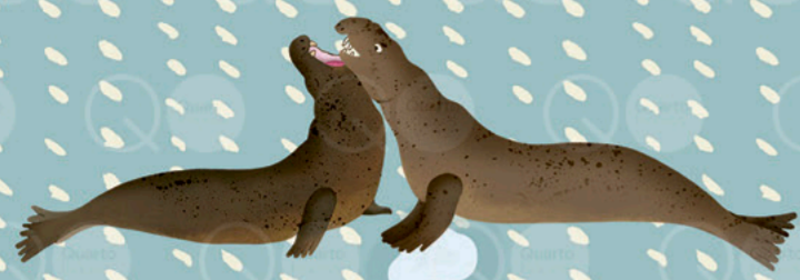
Ringkämpfe austragen mit dem SEEELEFANTEN (Südliche Orkneyinseln)