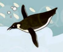
Eng aneinanderkuscheln mit den KAISERPINGUINEN (Taylor-Gletscher)