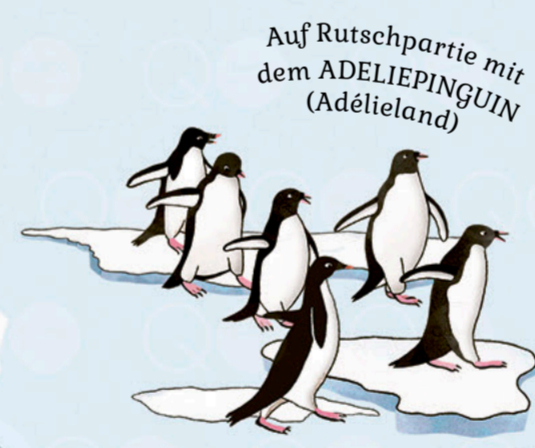
Auf Rutschpartie mit dem ADELIEPINGUIN (Adélieland)