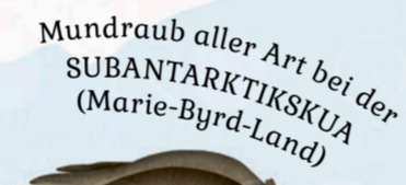
Mundraub aller Art bei der SUBANTARKTIKSUA (Marie-Byrd-Land)