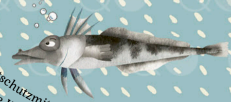
Mit Frostschutzmittel durch die Kälte mit dem EISEFISCH (Bellingshausen-See)