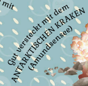
Gut versteckt mit dem ANTARKTISCHEN KRAKEN (Amundsensee)