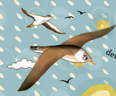
Auf Rekord-Rundflug mit dem DUNKLEN STURMTAUCHER (Aucklandinseln)