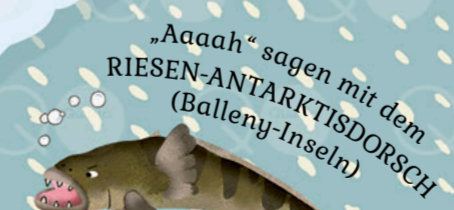
„Aaaaah“ sagen mit dem RIESEN-ANTARKTISDORSCH (Balleny-Inseln)