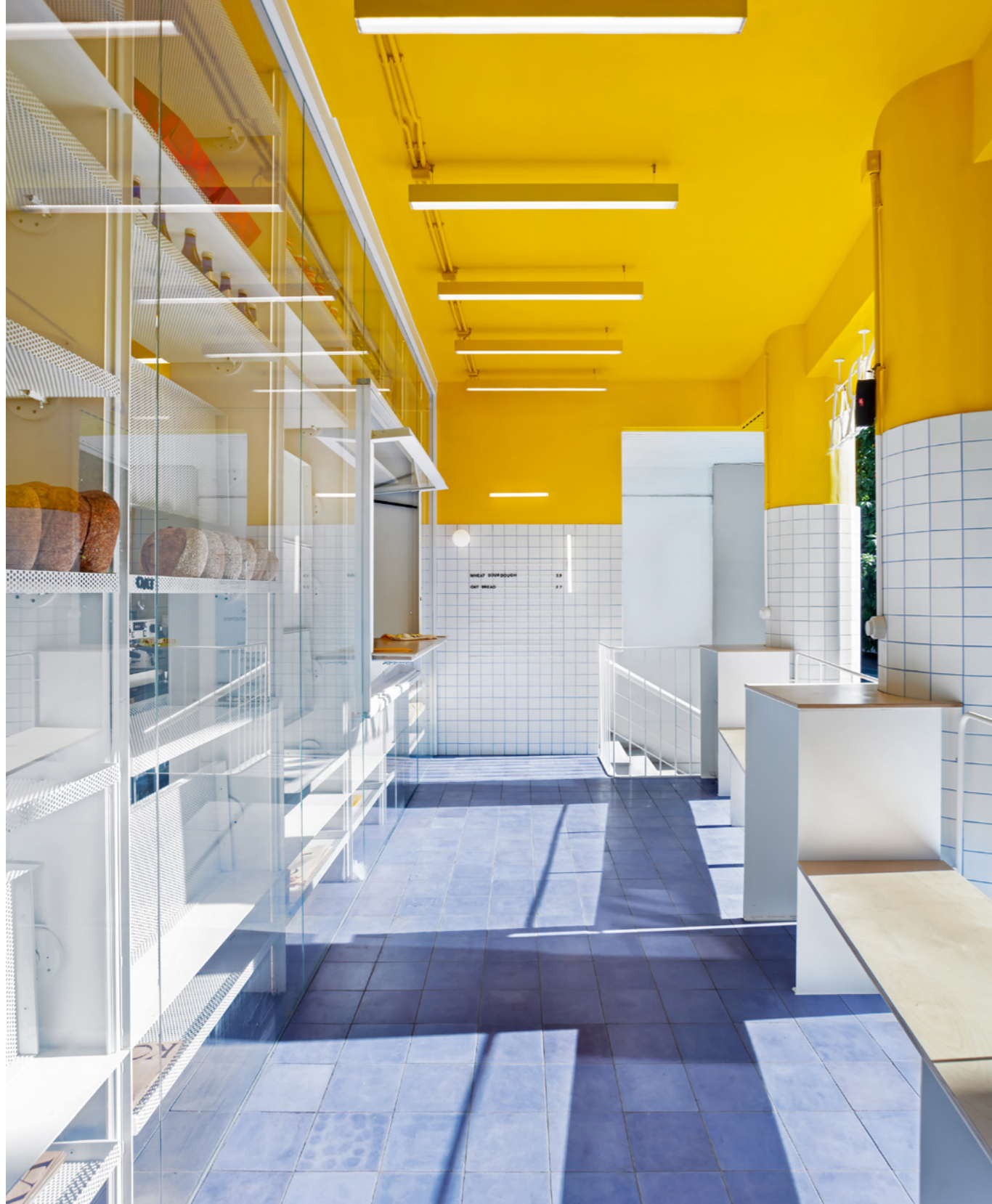
Den ungewöhnlich erhöhten, zurückgesetzten Terrassenbereich von Kora gestaltete das Designteam als schicke Bühne für die Backwaren. Drehbare Metallregale gewähren transparente Einblicke vom Verkaufsbereich bis zur Backstube, die durch die quadratischen Kacheln und die gelbe Decke optisch verbunden sind.