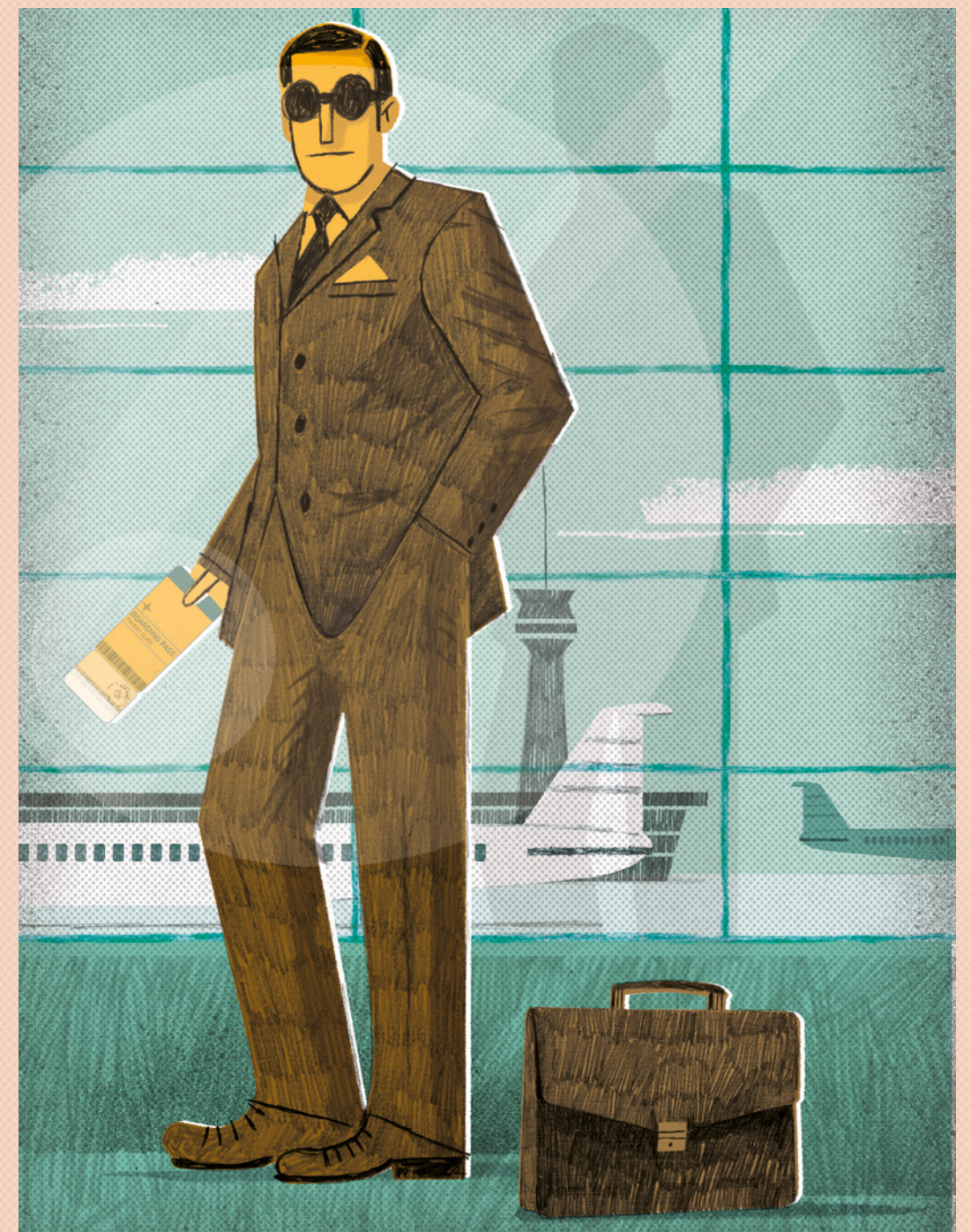
DAN COOPER WARTET MIT DEM TICKET IN DER HAND AUF DAS BOARDING FÜR DIE BOEING 727 MIT ZIEL SEATTLE.

Cooper bestieg pünktlich sein Flugzeug und setzte sich in die letzte Reihe auf Sitz 18C. Mit ihm reisten 36 Passagiere und sechs Besatzungsmitglieder.