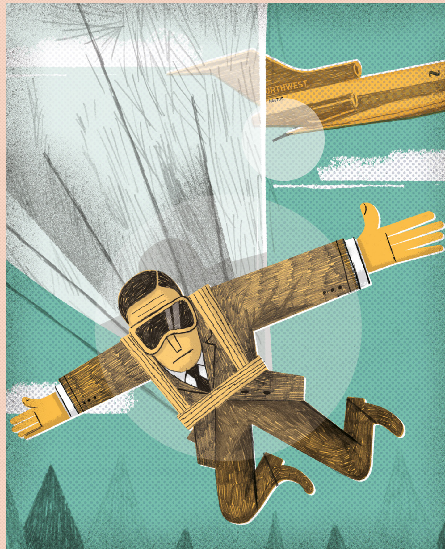
COOPER SPRANG AUS DEM HINTEREN AUSSTIEG INS LEERE. UNTER IHM BREITETEN SICH DIE ENDLOSEN GEBIRGE UND WÄLDER DES STAATES WASHINGTON AUS.

IM HANDGEPÄCK, DAS COOPER DER STEWARDESS ZEIGTE, WAREN ROTE DYNAMITSTANGEN, EINE BATTERIE UND KUPFERDRAHT. EXPERTEN VERMUTETEN SPÄTER, DASS ES KEINE ECHTE BOMBE WAR.