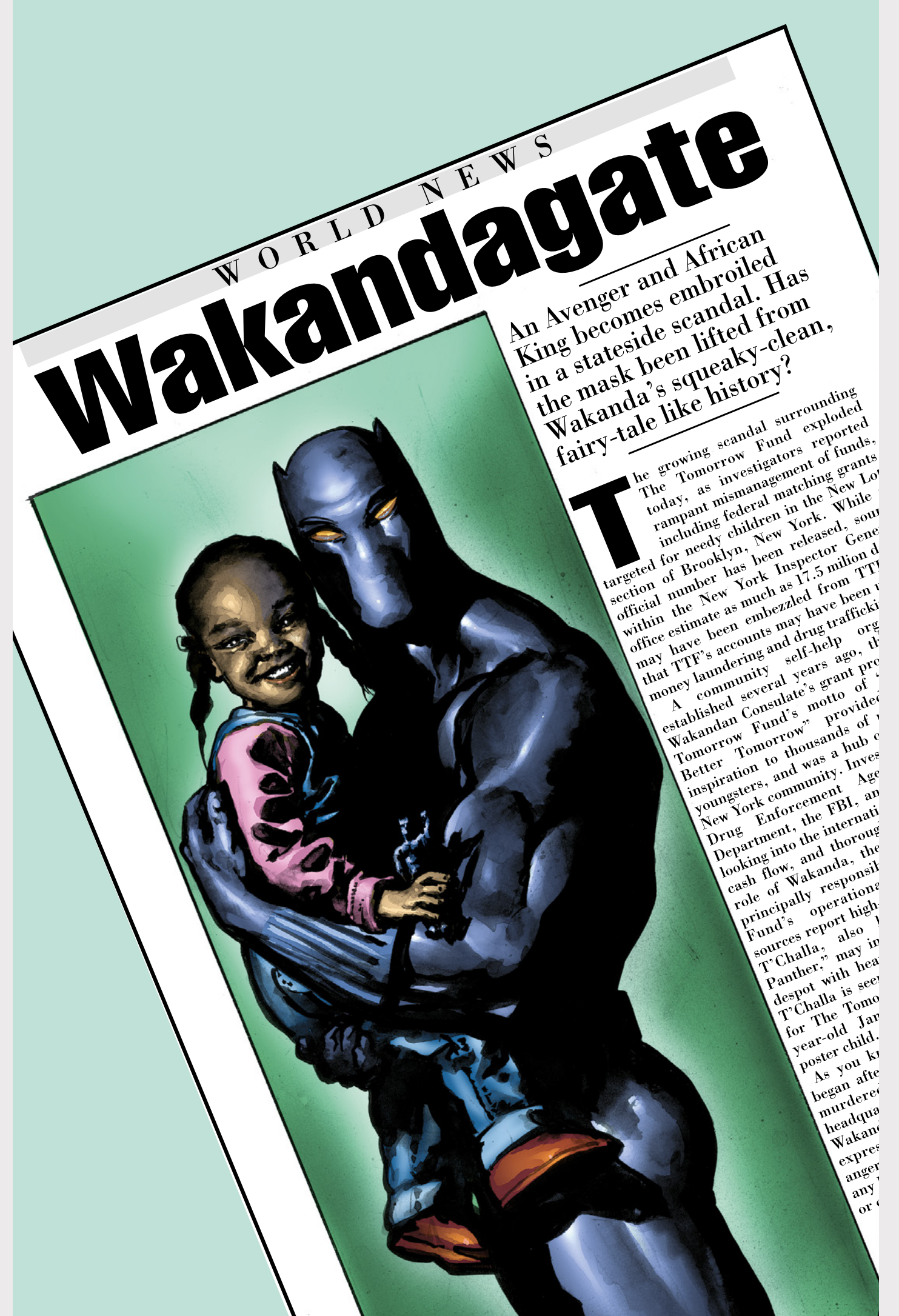
L'évolution visuelle de la Panthère noire concerne autant sa terre d'origine, le Wakanda, que le personnage lui-même.