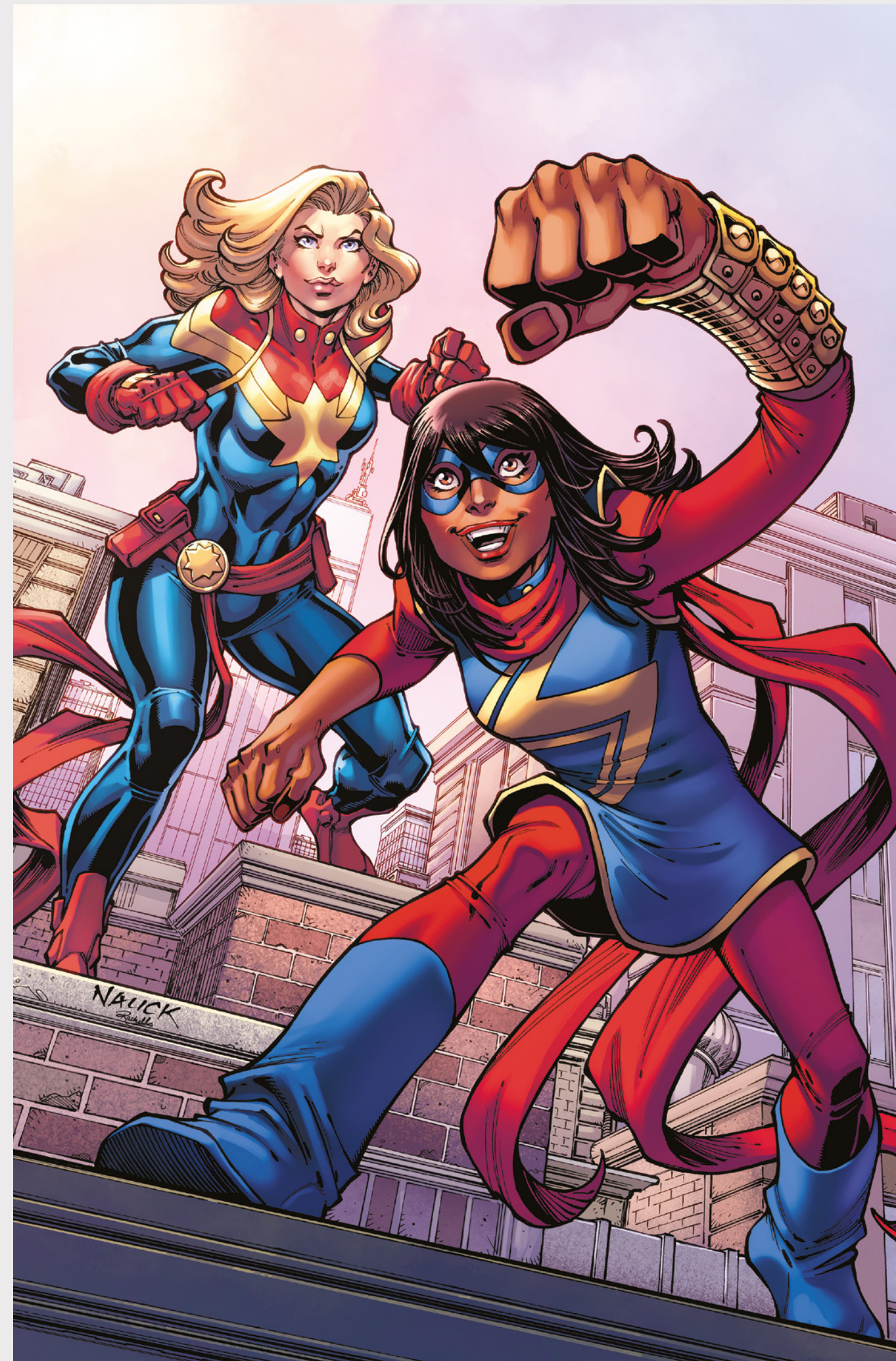
Ms. Marvels charakteristischer Blitz tauchte zum ersten Mal in Ms. Marvel 20 (Oktober 1978) auf. Das Symbol wurde schnell zum Inbegriff der Heldin und findet sich noch immer auf Ms. Marvels aktuellem Anzug, der von Jamie McKelvie für Kamala Khan designet wurde.